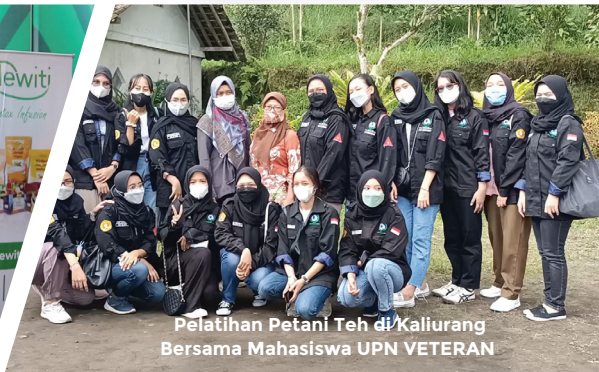
Pelatihan Petani Teh di Kaliurang Bersama Mahasiswa UPN VETERAN