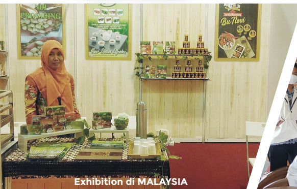
Exhibition di MALAYSIA