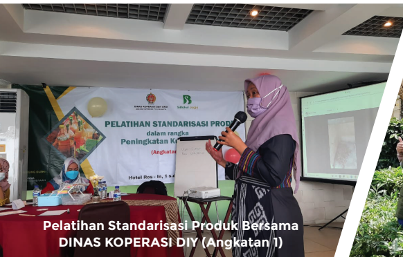
Pelatihan Standarisasi Produk Bersama DINAS KOPERASI DIY (Angkatan 1)