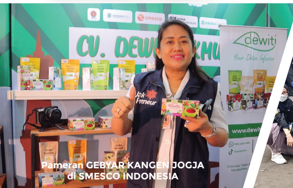
Pameran GEBYAR KANGEN JOGJA di SMESCO INDONESIA