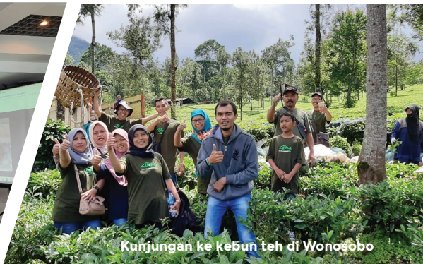
Kunjungan ke kebun teh di Wonosobo