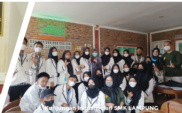
Kunjungan Industri Gari SMK LAMPUNG